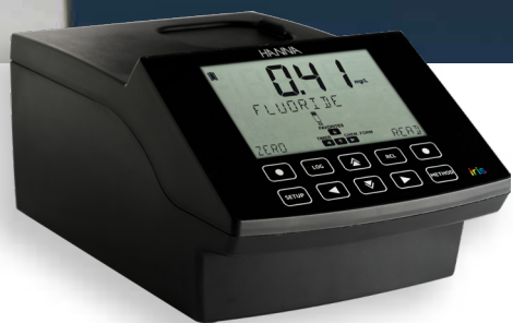
Espectrofotómetro iris HI801